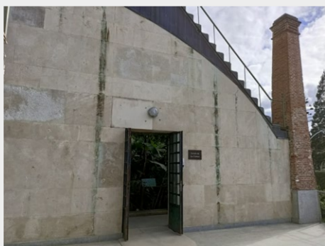
Invernadero Santiago Castroviejo