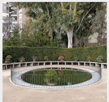
Estanque de los Bonsáis