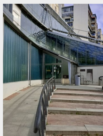
Aula didáctica Celestino Mutis