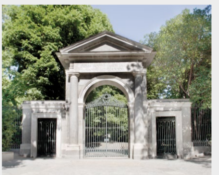
Puerta del Rey