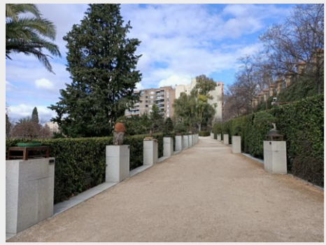
Terraza alta de los Bonsáis