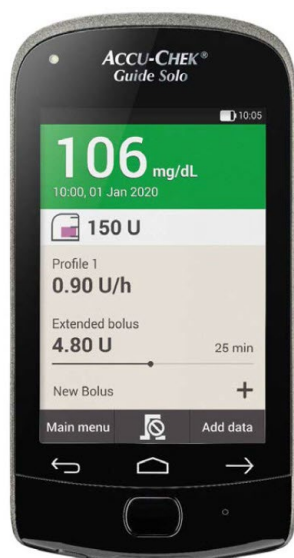
Accu-Chek Guide Solo