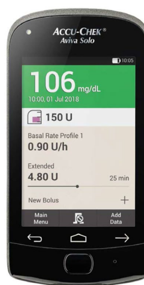
Accu-Chek Aviva Solo